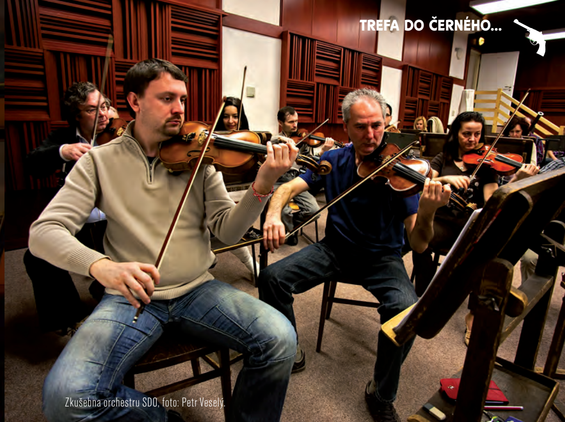
Zkušebna orchestru SDO, foto: Petr Veselý.