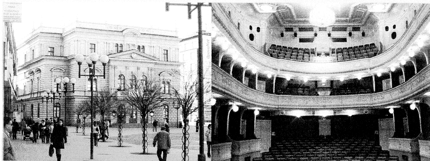
Slezské divadlo Opava...

chestrální hráči, členové baletu) a z nichž někteří spolupracují se Slezským divadlem úspěšně dodnes. Jmenujme alespoň sbormistryni Kremenu Pešakovou, která dokáže i ty nejnáročnější sborové party vypracovat