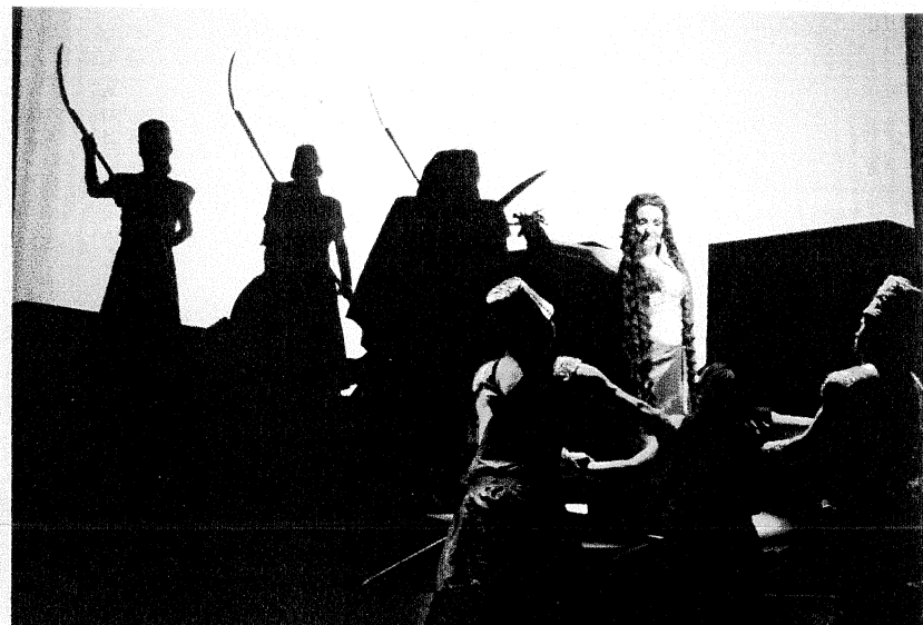
Saint-Saëns: Samson a Dalila