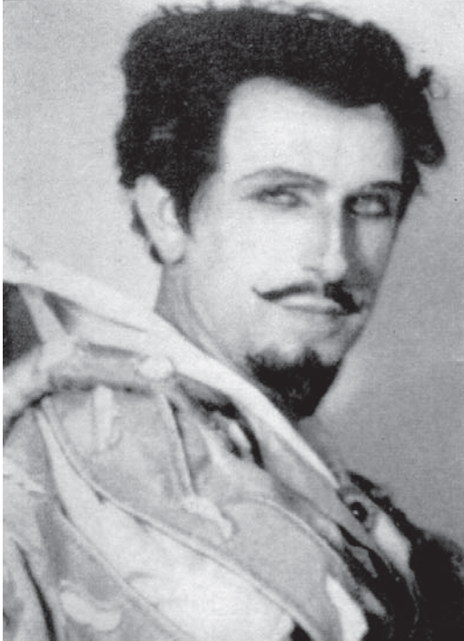
Hans Hotter jako Don Giovanni na Salzburger Festspiele 1946