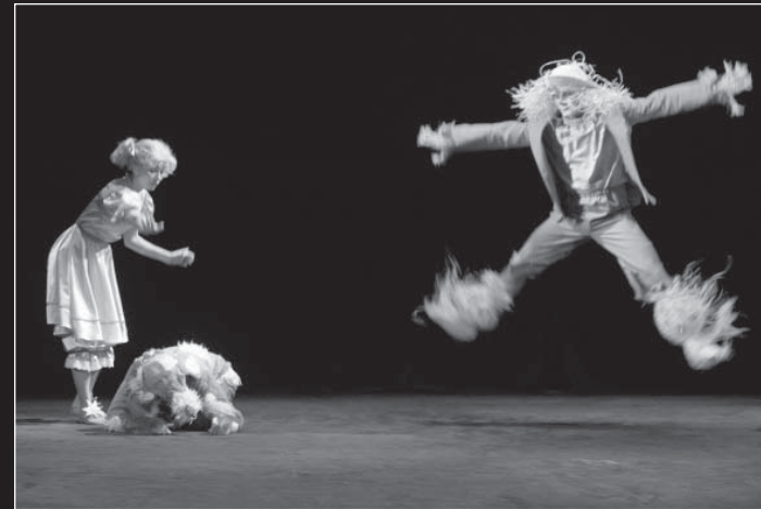
Největší mistři baletu vždy vzbuzují dojem, jako by jejich tělo bylo zbaveno vsí tíže.