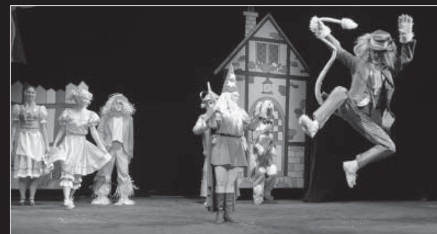
Tanec – jako by hudba dostala tvar a stala se doslova hmatatelnou.