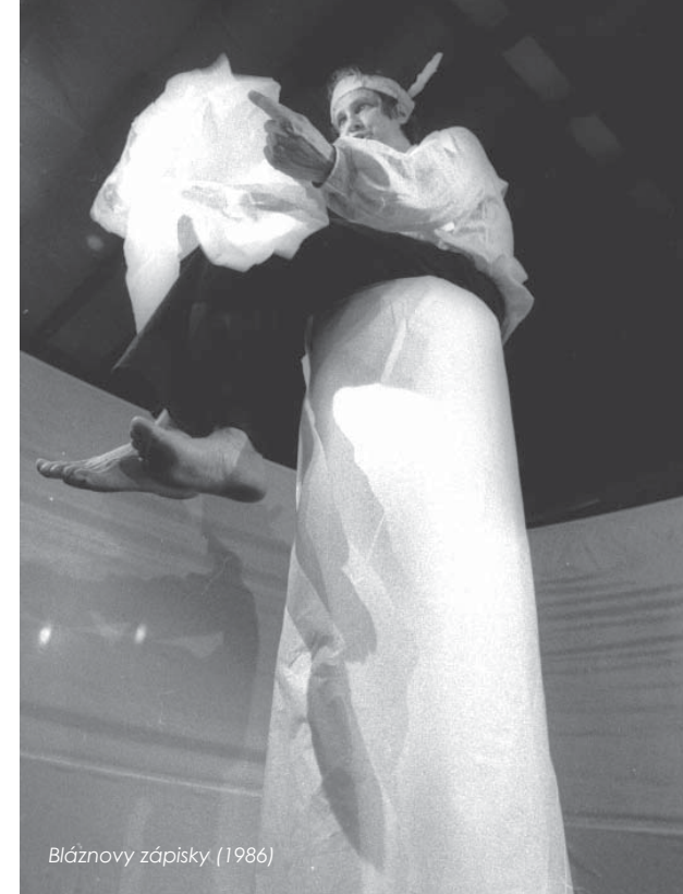
Bláznovy zápisky (1986)

Odešel jsi na volnou nohu po úspěšném celostátním ocenění Tvého výkonu v Gogolových Bláznových zápiscích, kdy začala nová etapa Tvé tvůrčí herecké práce, v divadle jednoho herce. Tvé divadlo s pevnou scénou se jmenuje Harlekýn. Přesto se vracíš do opavské činohry, aniž bys oslaboval svůj herecký náboj, který nikdy nelze nazvat lehce upoceným tričkem.